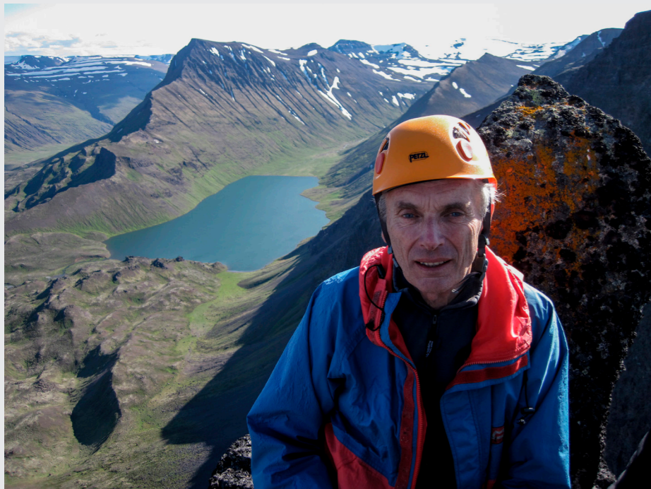
Bjarni á Hraundranga 31. júlí 2012. Í baksýn er Vatnsdalur, með Hraunsvatni í botni, handan þess Þverbrekkuhnjúkur.