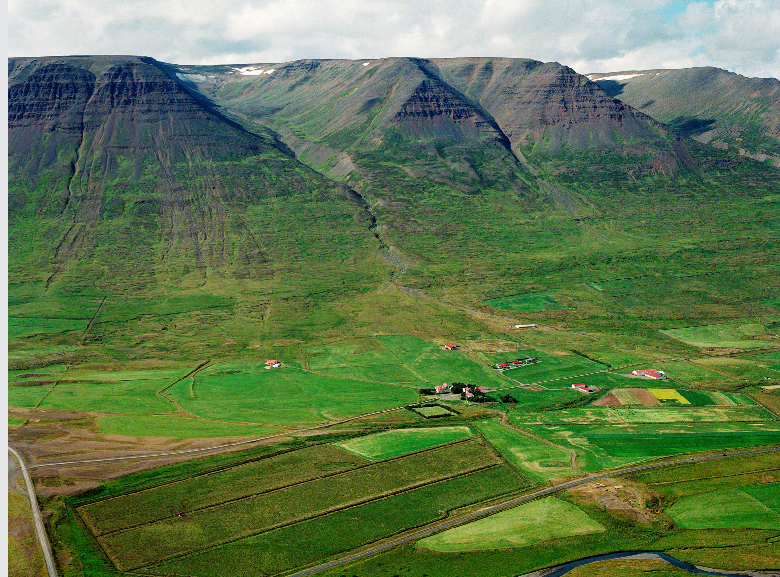
Möðruvellir í Hörgárdal. Yfirlitsmynd. Að baki eru frá vinstri Staðarhnjúkur og Staðarskarð, Prastarhólshnúkur og Prastarhólsskarð.

Móðir Bjarna hafði orðið fyrir trúarvakningu á yngri árum og innrætti börnum sínum þá trú sem hún taldi rétta. Hún var tengd KFUM-hreyfingunni, sem Friðrik Friðriksson stofnaði